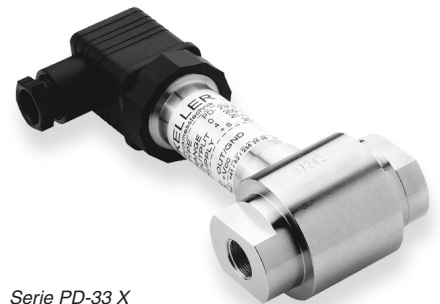
Serie PD-33 X