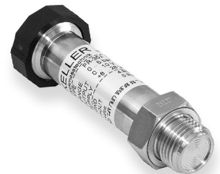
Serie 35 X G1/2", frontbündige Membrane