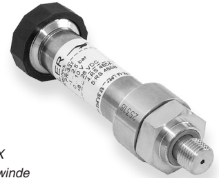
Serie 33 X G1/4" Gewinde

Diese Transmitter können mittels Korrektur der Verstärkung mit der PROG30 Software an jeden Standard Ihrer Wahl angepasst werden.