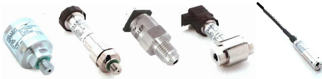
Рисунок 1 – Внешний вид преобразователей

Внешний вид преобразователей приведен на рисунке 1.